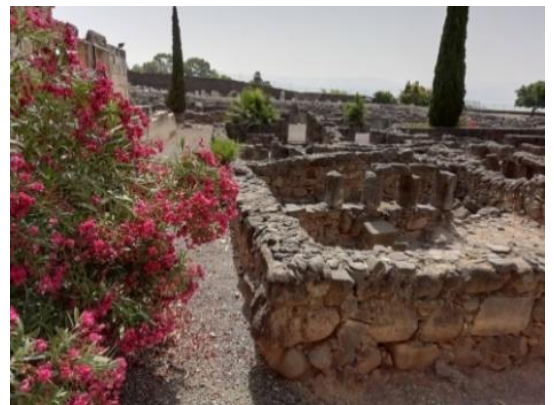
(Teich Bethesda.)

Eingeladen sind alle, die sich auf ganzheitlich-kreative Weise einem Bibeltext nähern möchten. Beim Bibliodrama übernehmen die TeilnehmerInnen in einem improvisierten Spiel Rollen des Textes. Eigene (Glaubens-)Erfahrungen kommen spielerisch ins Gespräch mit dem biblischen Text – ohne Regiebuch. Es gibt kein richtig und kein falsch, nur die Begegnung zwischen biblischem Text und uns selbst. So wird ein sehr persönlicher, manchmal auch überraschender Zugang zum biblischen Text und zu uns selbst möglich. Vorkenntnisse sind nicht erforderlich! Wenn vorhanden, bitte eine eigene Bibel mitbringen.