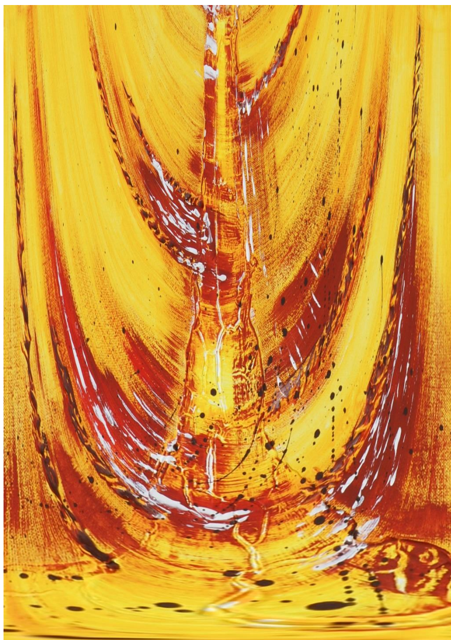
Bild: Martin Manigatterer - Sr. Hanna Ecker; In: Pfarrbriefservice.de

Nr. 3/21 | Lesejahr B | 27. März – 9. Mai 2021