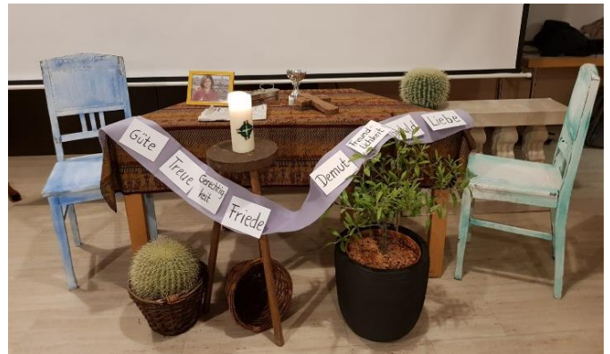
Das Band des Friedens beim Weltgebetstag in Bennigsen.